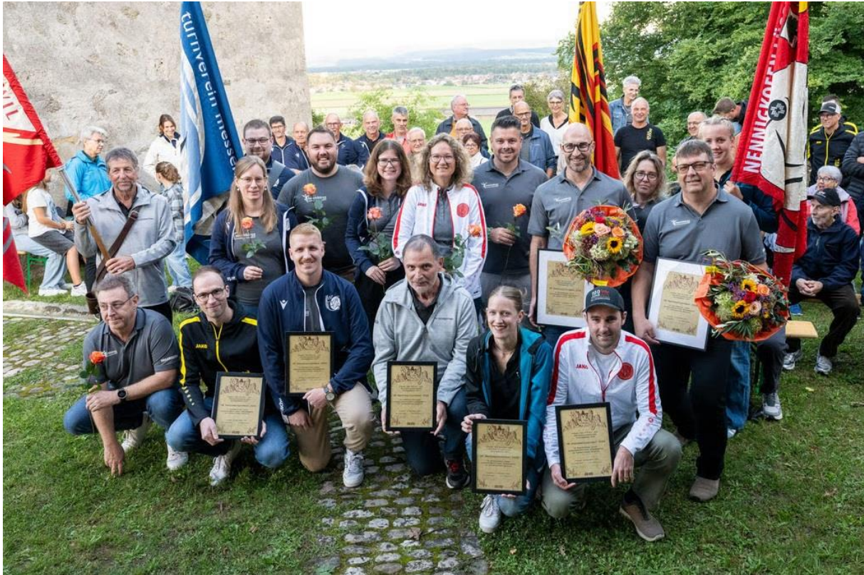
Die Kulturpreisträger 2025: anlässlich der Verleihung am 5. September 2025.

im und für den Bucheggberg kulturell, sozial oder sportlich verdient gemacht haben. Der 1992 erstmals verliehene Preis ist mit 1000 Franken dotiert.